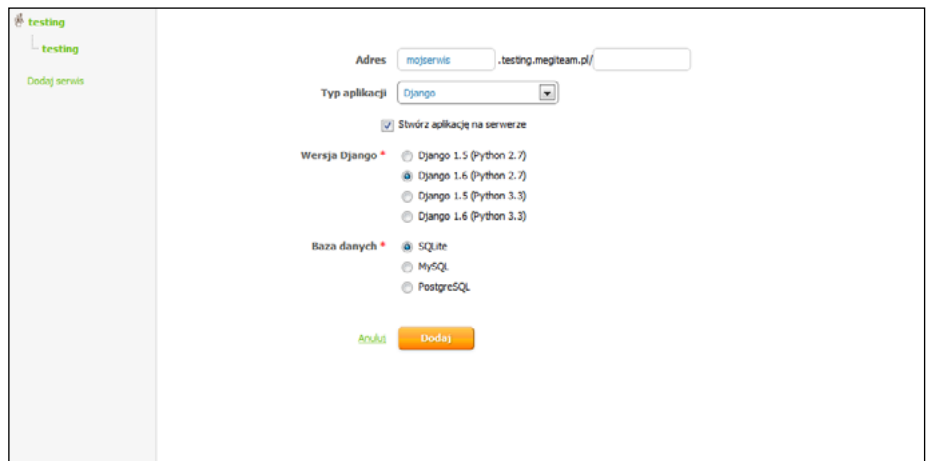
Rysunek 1. Konfiguracja aplikacji Django

MegiTeam to usługa hostingu nowoczesnych technologii w chmurze oferująca gotowe środowiska programistyczne, dzięki którym możliwe jest szybkie wdrażanie serwisów webowych i uruchomienie aplikacji jednym kliknięciem. Serwis dedykowany jest przede wszystkim dla twórców oprogramowania, startupów, agencji interaktywnych oraz przedsiębiorstw oferujących usługi e-commerce.